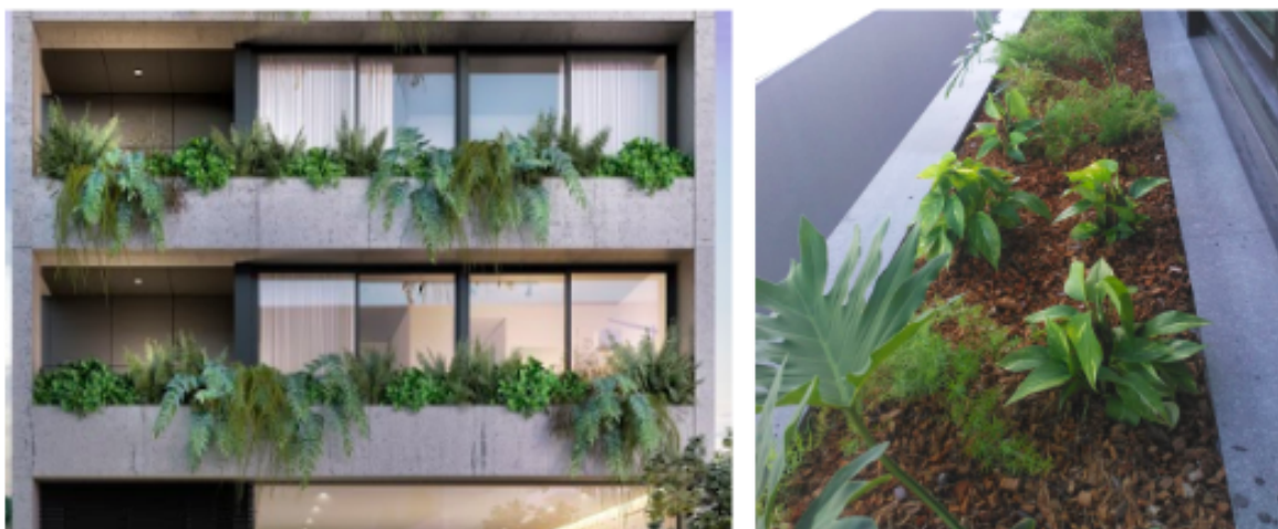
Floreiras de fachada de prédio com VasoFlex®

Os vasos são preenchidos com uma camada de substrato e de argila expandida para acabamento, unificando a parte superior dos vasos. As floreiras ficam imperceptíveis após o acabamento superior.