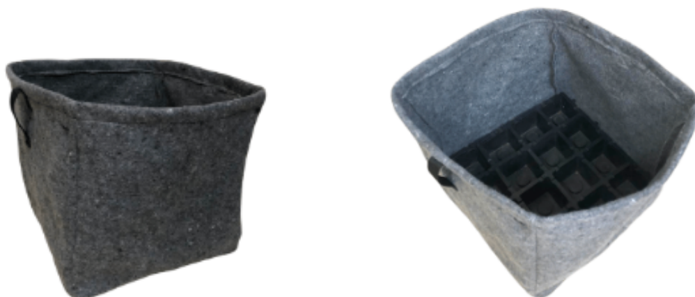
Módulo Macheta® com membrana de absorção.

As alças laterais reforçadas permitem fácil manuseio do vaso, facilitando também a poda das raízes quando necessário. Com tecido leve e funcional, o VasoFlex® potencializa o desenvolvimento da vegetação, proporcionando proteção térmica e melhor absorção e retenção da água da rega através de seu reservatório inferior (módulo Macheta®).